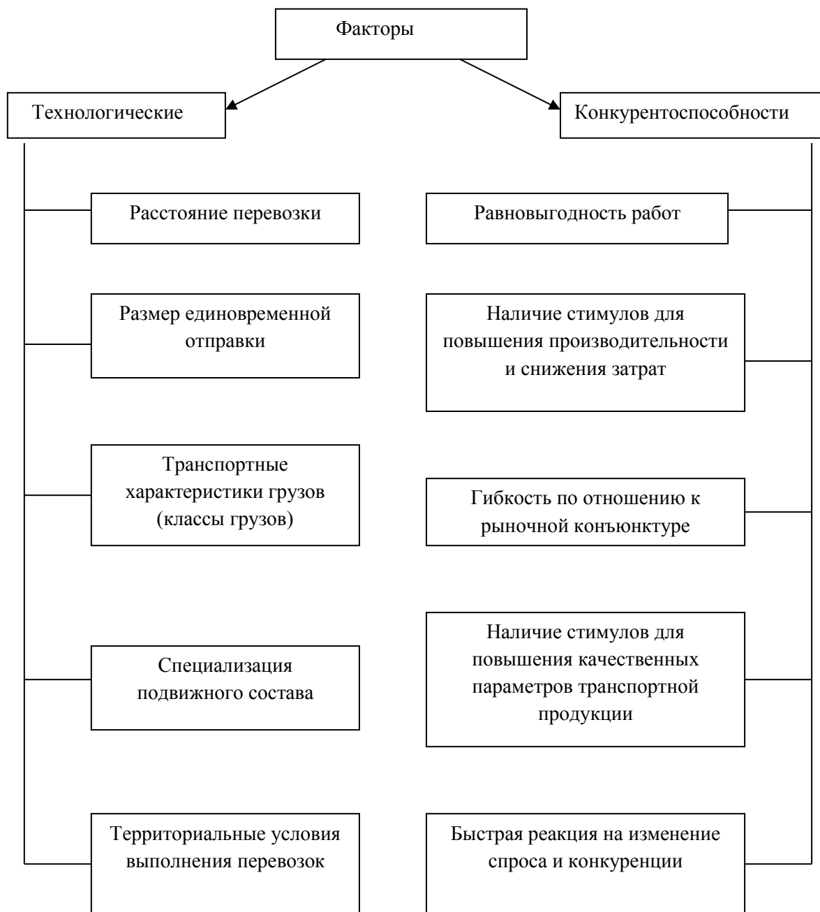
Рисунок – 2.7. Факторы, характеризующие принципы построения тарифных систем на транспорте