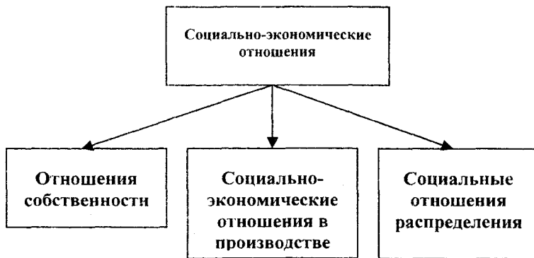
Виды социально-экономических отношений

Социально-экономические отношения являются специфическими. Они свойственны только одной стадии развития производства или одной экономической системе.